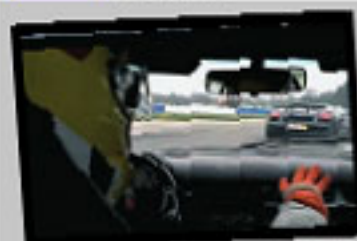
Aquiño se tratava de uma corrida mas sim de um 'track day' em Braga, destinado a 'gentlemen drivers' e suas máquinas. Salvador, ao volante de um Lotus Elise R, vai mostrando que não é daquele 'campeonato' e ultrapassa mais de 20 carros, entre Lamborghinis, Ferraris, Aston Martin, Ginettas e outros. O vídeo também vale pelos comentários bem humorados